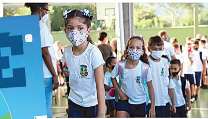
Alfabetização de 6 a 14 anos é de 98,3% Fonte: (IBGE) (Crédito: Eduardo Montecino)

Com foco em Educação e percentual de 21% da arrecadação em investimentos em obras de infraestrutura, a cidade vem na contramão do que acontece em diversas prefeituras do Brasil